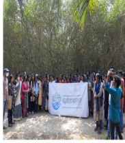
ബോ ജേർസിം കണ്ടൽ ധന മധ്യ