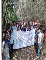
കണ്ടൽ ധന മധ്യ